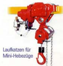
Laufkatzen für Mini-Hebezüge

Laufkatzen für die Mini-Hebezüge werden mit Fenner Lamellenmotor, Bonfiglioli Schneckenrad und 4 Laufrädern mit dauergeschmierten Lagern geliefert. Ein präzisionsgefertigtes Getriebe treibt 2 Laufräder. Die Bedienung erfolgt über Drucktastensteuerung mit NOT-AUS.